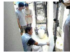
外壁や内部しっくい塗壁の塗り模様を立ち合いを行いました。