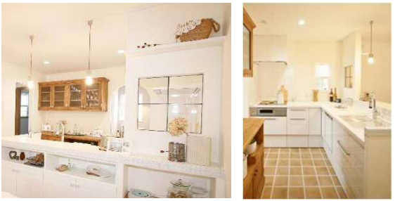
造作対面収納はモザイクタイルカウンター。L型キッチンのコーナーに壁をつくりアイアンのスタンドグラスを取り入れました。間仕切りにガラスを入れることで調理中も、リビングで遊ぶ子供達の様子をCHECK!